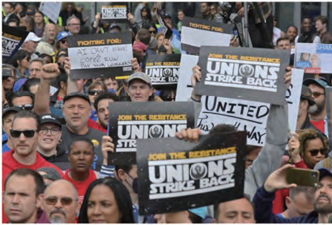
2023年作業ストライキの一環としてロサンゼルスで労働組合が開催