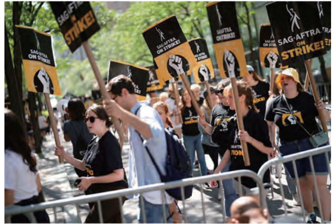
SAG-AFTRAストライキ