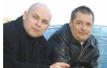
Jean-Pierre Junet & Marc Caro ジュネ & カロのコンビで、新しい映像技術をいち早く取り入れた斬新な映像作品を生み出してきた2人は、「ロストチルドレン」を境に、別々の道を歩むことになるが、現在のジュネ作品においても、その映像的アプローチにはカロから受けた影響が強みられる

これに対して、今回の「ロング・エンゲージメント」のストーリーは、フランスでベストセラーとなったミステリー小説がもとになっている。物語の舞台は、第1次世界大戦下のブルターニュ地方。フランスとドイツの国境にある前線で、5人のフランス兵が、ドイツ軍の標的になるべく荒野に置き去りにされた。彼らがみずからの身体を故意に痛めつけて、兵役を逃れようとしたというのが理由だった。そして、この5人のフランス兵の一人が