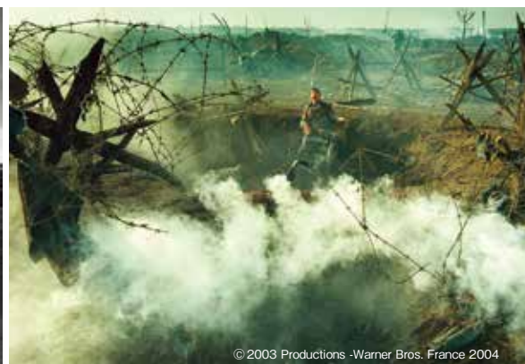
© 2003 Productions -Warner Bros. France 2004