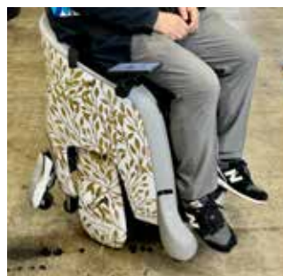
JAPAN MOBILITY SHOW BIZWEEK HONDA UNI-ONE に試乗してみた。身体を傾げるだけで、左右、前に進む。時速6Km程度というが、つかまるものがないと不安を感じると、開発者に伝えた。