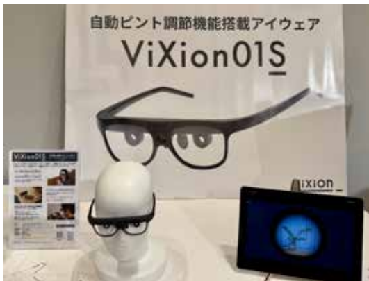
総務大臣賞 ViXion01S ~眼のピント調節機能を代替・拡張する次世代アイウェア~ (ViXion 株式会社)