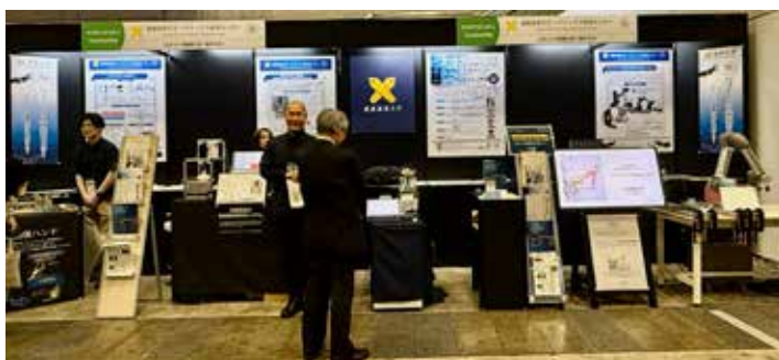
慶應義塾大学バプティクス研究センター：リアルバプティクス技術で熟練者の技を記録・再生。リアルバプティクス技術を用いて、研磨のノウハウをリーダーフォロワー（親機子機）ロボットで収集し、その情報を用いて自立的に賢い研磨作業を行う。