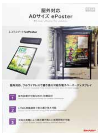
経済産業大臣賞 屋外対応 A0 サイズ ePoster (シャープ株式会社)