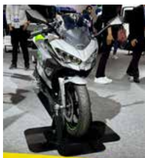
JAPAN MOBILITY SHOW BIZWEEK カワサキ EV Ninja 燃料タンク部分に2本のバッテリーが入る。