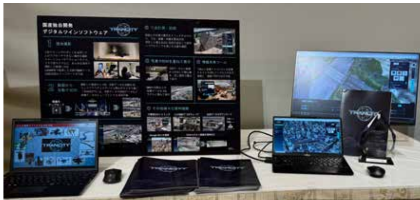
デジタル大臣賞 デジタルツインソフトウェア【TRANCITY】(CaITa 株式会社)