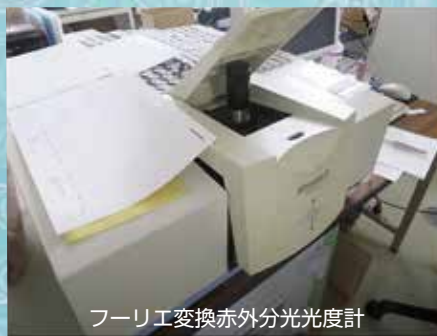
フーリエ変換赤外分光光度計