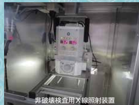
非破壊検査用X線照射装置