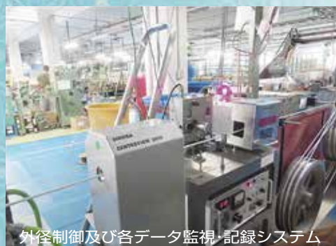
外径制御及び各データ監視・記録システム