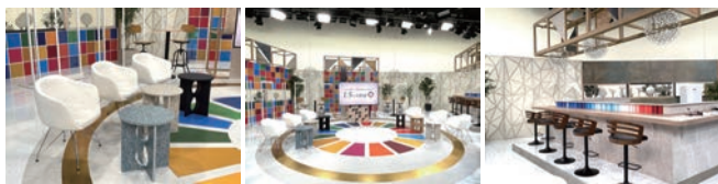
リユース・リサイクル可能なスタジオセット

「地球沸騰化」が叫ばれ、気候危機が深刻の度を増す中、ことしは、気候変動対策の国際会議も節目の年を迎え、COP30がブラジルで開かれる。日々のニュース番組で最新情報をタイムリーに伝えるほか、スペシャル番組、子ども向けコンテンツなど、幅広い世代に向けて発信し、社会の関心をより喚起することをめざし、合わせて、放送設備の省エネ、再生素材を活用した美術セットの開発・導入など、脱炭素社会・循環経済の実現に向けた取り組みをより一層推進していくとしている。