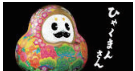
石川県の観光PRマスコットキャラクター「ひやくまんさん」

世界を見渡せば、相変わらずお隣の大国は戦争を集結させる様子はなく、むしろ軍人の給与を大幅に増やして増員を図っているといった有様で、一方の太平洋の向こうの友好国と思われる大国では、自国の利益につながる事にばかり執着しているカードゲームと同じ名前の大統領が就任している。